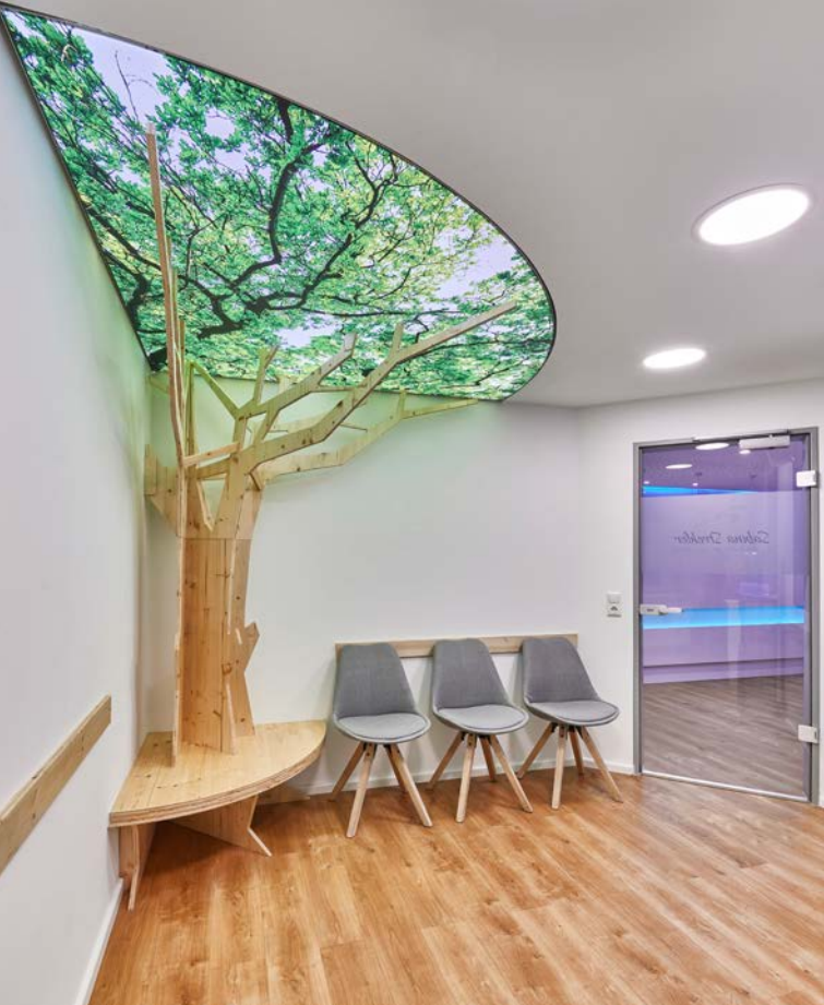
Abb. oben: Als atmosphärisches Element und Ergänzung zu den opaken Downlights wurde im Wartebereich ein hinterleuchteter Spanndiarmrahmen installiert, der eine Baumkrone zeigt.