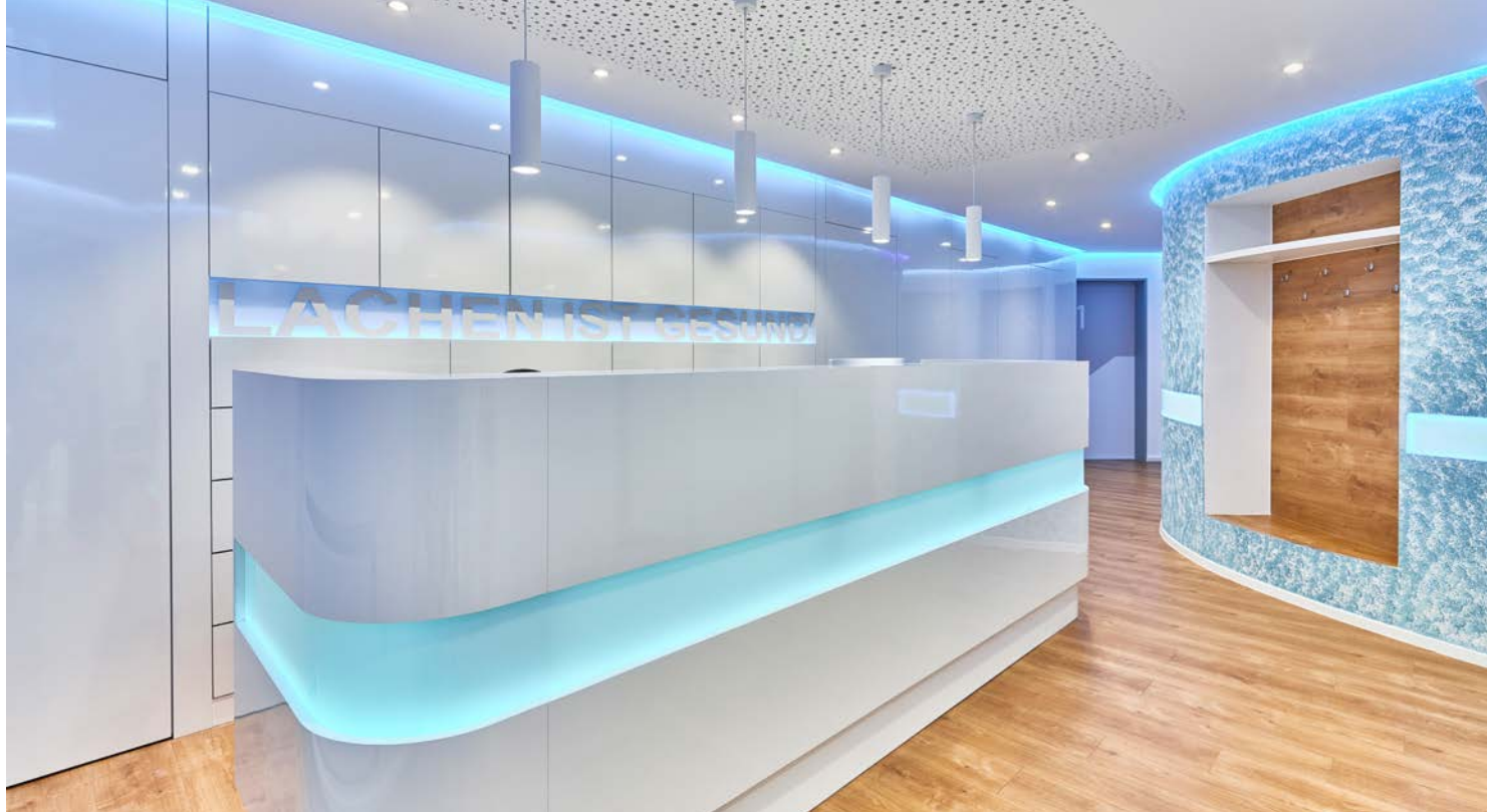
Abb.: »Lachen ist gesund« – dieser Schriftzug empfängt den Patienten. Die blaue Lichtfarbe zieht sich durch den gesamten Wegebereich und lässt sich über ein Tableau variabel steuern.

Abb. linke Seite: Die Rundung des Durchgangsbereiches wird durch Einbaudownlights mit 859 lm und einem Abstrahlwinkel von 71° betont und von einem RGB-Band in der Deckenvoute ergänzt.