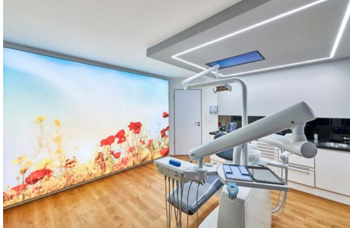
Abb. oben: In den Behandlungsräumen wählte man als Grundbeleuchtung ein Quadrat aus homogenen Lichtlinien. Der Spanndiarmahmen wird mit unterschiedlichen Naturmotiven bedruckt und leuchtet vollflächig in Tageslichtfarbe (6500 K).

Als Kombination zur Grundbeleuchtung wurde auch hier als Highlight in jedem Behandlungsraum ein wandfüllender ca. 3m x 3m großer Spanndiarmahmen mit einem Naturmotiv eingesetzt. Die LEDs in Tageslichtfarbe (6500 K) und einem Lichtstrom von insgesamt 46.000 Lumen sind auf einem weißen Aluminiumblech aufgebracht und mit einem textilen Spanntuch mit Digitaldruck überzogen. Die vollflächig hinterleuchteten Spanndiarmahmen zeigen in jedem Raum ein anderes Naturmotiv – ein Fotoausschnitt eines Waldweges, im nächsten Zimmer der Ausschnitt eines Sonnenunterganges in einer Blumenwiese und im dritten Behandlungsraum einen Strandabschnitt und die Weite des Meeres. Hier wird der Eindruck vermittelt, man liege direkt in der Natur oder schaue durch ein übergroßes Fenster in die Ferne. So ist der Patient entspannt und abgelenkt und genießt das stressfreie Ambiente. Das Highlight sind die in die Decke eingelassenen Monitore über den Behandlungsstühlen. Hier können Filme abgespielt werden und mit entsprechenden Kopfhörern kann der Patient während der Behandlung einen Film genießen. Bei großen und kleinen Patienten sorgt dies für großen Anklang.